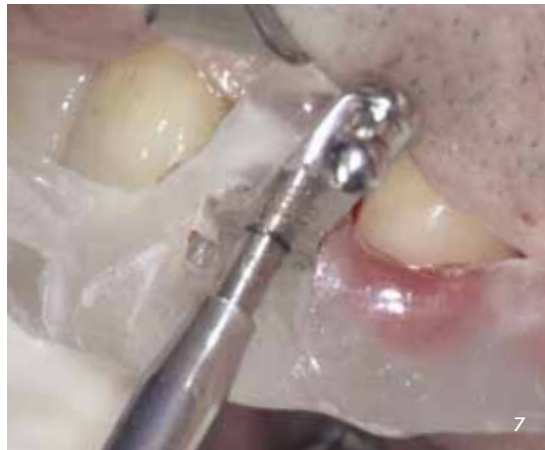
Abb. 6 und 7 Weitere Aufbreitung des Implantatbettes mit dem Osteotom und anschließend, unter Führung der Bohrscha- blone, mit einem koni- schen Gewindeschneider