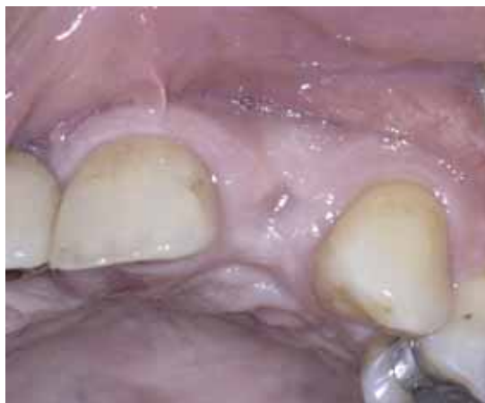
Abb. 1 Zustand drei Monate nach Extraktion des nicht erhaltungswürdigen Zahnes 22

Nach ausführlicher Aufklärung entschied sich der Patient für den Lückenschluss durch eine implantatgetragene Krone und unterschrieb eine entsprechende Einverständniserklärung. Nach der Entfernung des Zahnes samt Zyste war eine längere Ausheilungszeit erforderlich, weshalb die Lücke 22 temporär mit einer herausnehmbaren Teilprothese