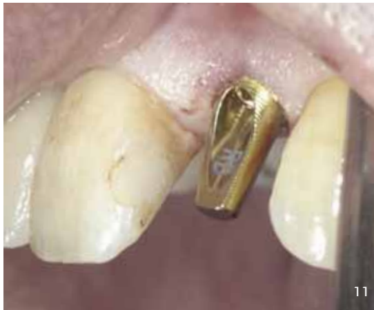
Abb. 11 und 12 Fixierung des Estheticabutments