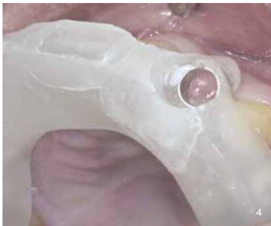
Abb. 5 Aufbereitung des Implantatbetts mit einem konischen Vorbohrer