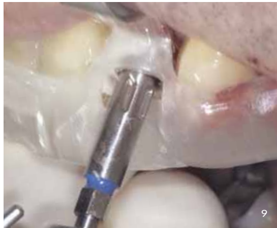
Abb. 8 und 9 Einbringen und Festziehen des konischen Implantates in Endposition