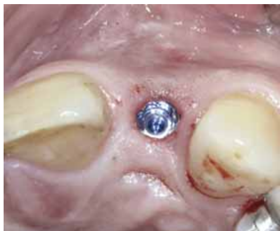
Abb. 10 Atraumatisch, transgingi- val in korrekter Position eingebrachtes Implantat

Um die dünne bukkale Kortikalis des Alveolarfortsatzes im späteren apikalen Bereich des Implantats nicht zu perforieren, wurde zur weitem Aufbreitung des Implantatbettes ein Osteotom (1,8-2,5mm und 1,9-3,0mm) benutzt (Abb. 6). Danach wurde vorsichtig ein implantatkongruenter, konischer Gewindeschneider bis zur endgültigen Aufbereitungstiefe eingedreht (Abb. 7) und abschließend