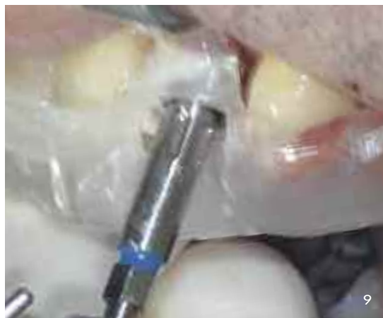
Abb. 8 und 9 Einbringen und Festziehen des konischen Implantates in Endposition