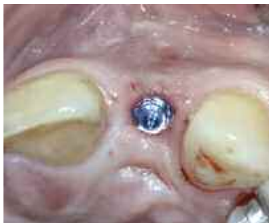
Abb. 10 Atraumatisch, transgingi- val in korrekter Positi- on eingebrachtes Implantat

Um die dünne bukkale Kortikalis des Alveolarfortsatzes im späteren apikalen Bereich des Implantats nicht zu perforieren, wurde zur weiteren Aufbreitung des Implantatbettes ein Osteotom (1,8-2,5mm und 1,9-3,0mm) benutzt (Abb. 6). Danach wurde vorsichtig ein implantatkongruenter, konischer Gewindeschneider bis zur endgültigen Aufbereitungstiefe eingedreht (Abb. 7) und abschließend