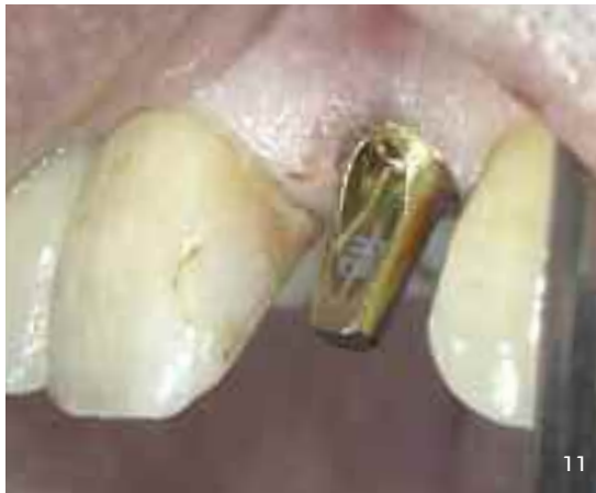
Abb. 11 und 12 Fixierung des Estheticabutments