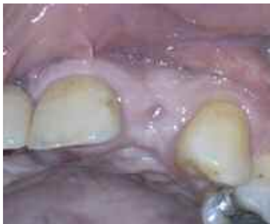
Abb. 1 Zustand drei Monate nach Extraktion des nicht erhaltungswürdigen Zahnes 22

Nach ausführlicher Aufklärung entschied sich der Patient für den Lückenschluss durch eine implantatgetragene Krone und unterschrieb eine entsprechende Einverständniserklärung. Nach der Entfernung des Zahnes samt Zyste war eine längere Ausheilungszeit erforderlich, weshalb die Lücke 22 temporär mit einer herausnehmbaren Teilprothese