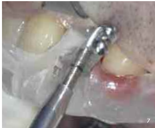
Abb. 6 und 7 Weitere Aufbreitung des Implantatbettes mit dem Osteotom und anschließend, unter Führung der Bohrscha- blone, mit einem koni- schen Gewindeschneider