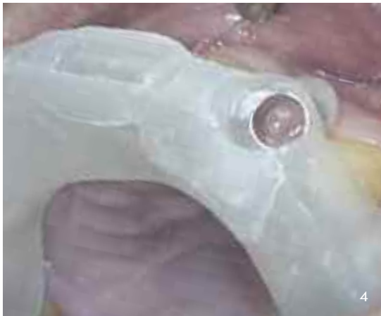
Abb. 5 Aufbereitung des Implantatbetts mit einem konischen Vorbohrer